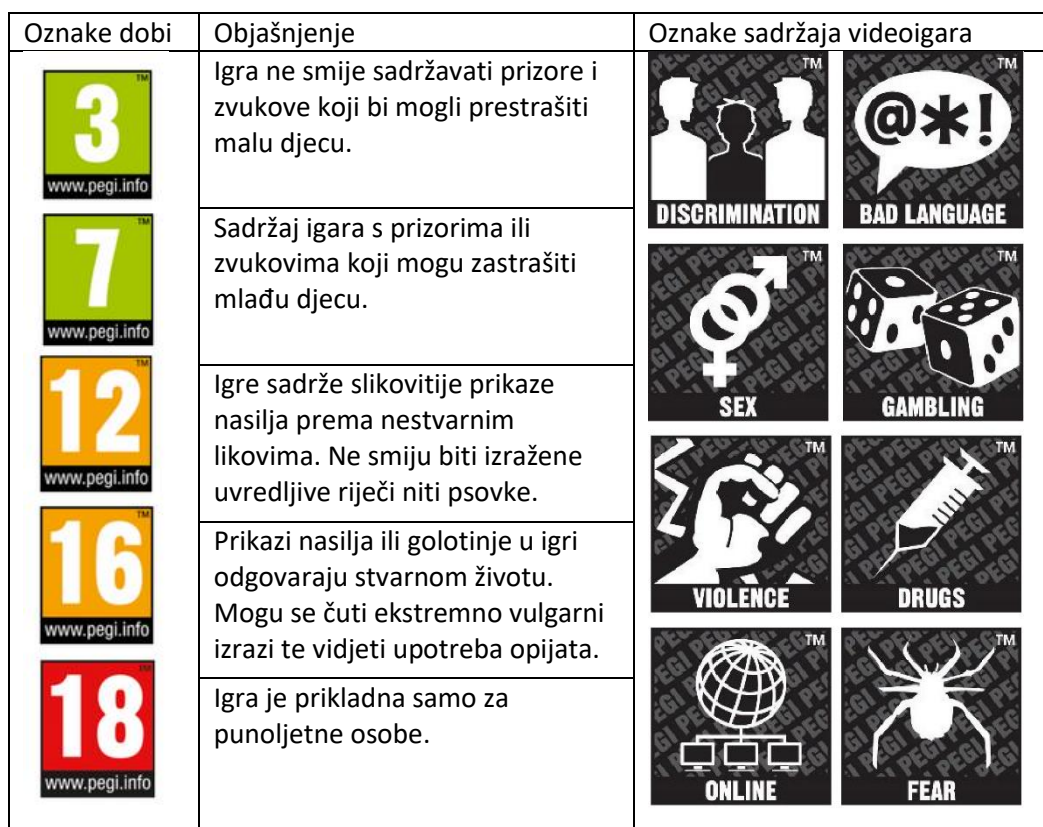
Tablica s PEGI oznakama za videoigre

Da bismo se lakše snalazili u izboru igara koje su primjerene za određenu dob, osmišljen je sustav dobnih oznaka PEGI . Dobna oznaka potvrđuje da je igra prikladna za igrače iznad navedene dobi pa je, primjerice, igra s oznakom PEGI 7 namijenjena djeci od sedam godina i starijoj, dok je ona s oznakom PEGI 18 prikladna samo za punoljetne osobe.