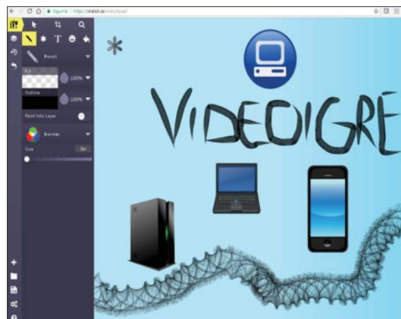
Slika 38. Prozor programa Sketchpad

Osim olovkom za crtanje, možete crtati i sličicama (smajlići, zvjezdice, srca i sl.), a boja kista može biti u duginim bojama.